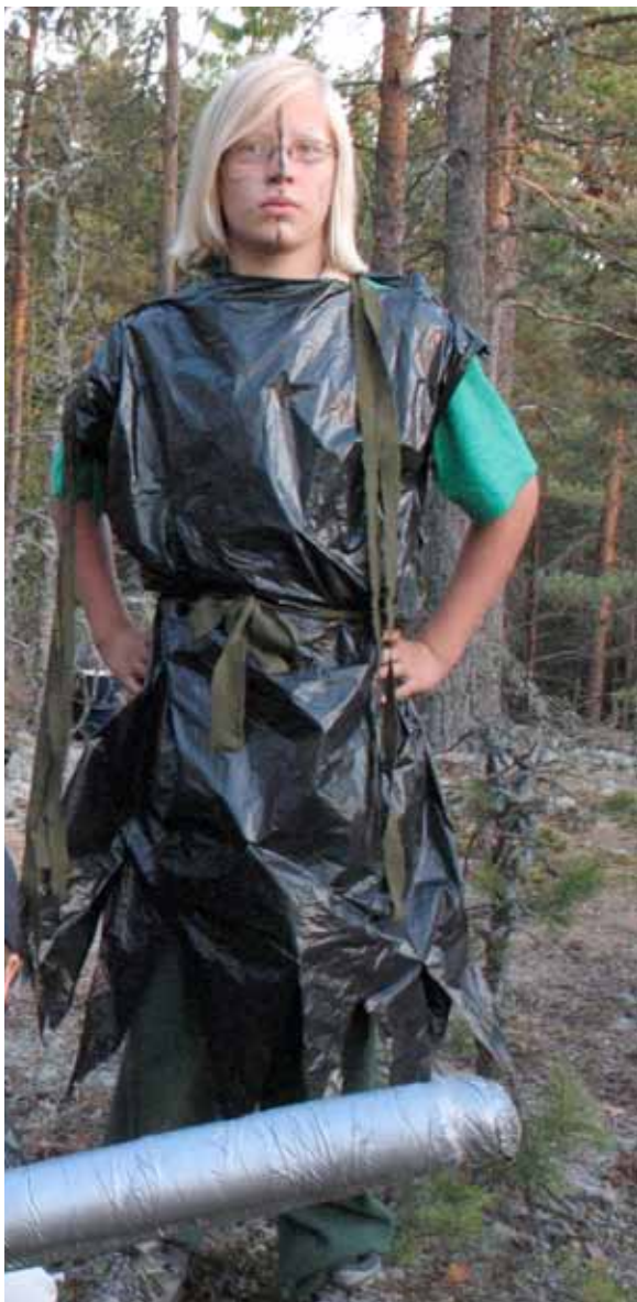
Meccala kesäleiri 2006