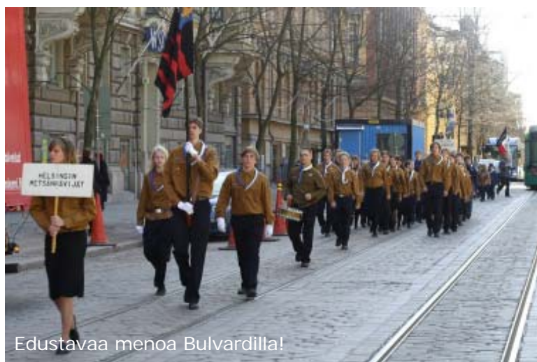
Edustavaa menoa Bulvardilla!