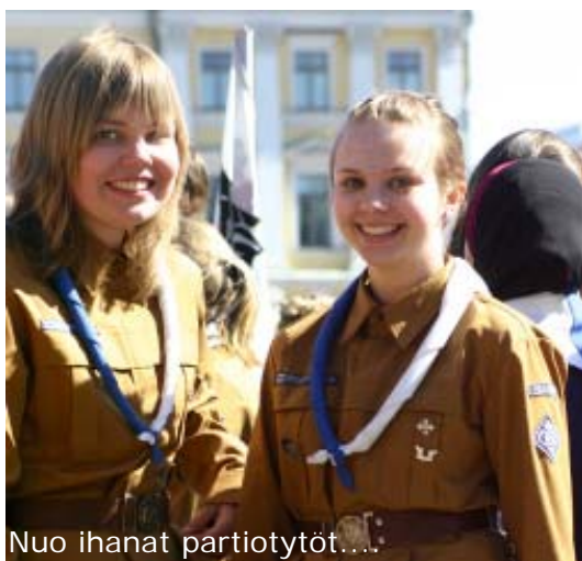
Nuo ihanat partiotytöt....

Matkalla tarttuivat mukaan muutkin Pääkaupunkiseudun mänkijät ja tunnin odotuksen, seisomisen, katsomisen ja huutamisen jälkeen lähtivät Metsänkävijälippukunnat, viimeisinä vaan ei vähäisimpinä, upeasti marssimaan. Esiinnyttiin oikein eduksemme kun kuuleman mukaan näkyi, että oli harjoiteltu. Perillä sitten kukin lähti omille teilleen, kuka minnekin.