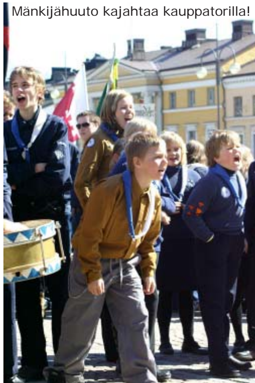
Mänkijähuuto kajahtaa kauppatorilla!

Tavattiin aamuvarhaisella Kaivopuistossa, ja kun kaikki viimein olivat paikalle löytäneet, aloitimme marssiharjoitukset. Jossain vaiheessa alkoi kaikille sitten tulla nälkä, joten harjoitukset katsottiin päättyneiksi, jolloin saimme viimeinkin ruokaa. Tarjolla oli perunasalaattia, lihapullia, mehua ja patonkia. Kun kaikki olivat syöneet ensimmäisen erän, saivat vielä nälkäiset ottaa lisää. Kun viimeinenkin patonginpala oli kadonnut, oli aika suunnistaa Senaatintorille.